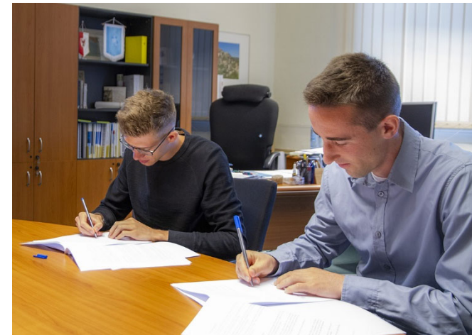
Unterzeichnung der Bildungsverträge (2019)